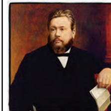
ЧАРЛЬЗ СПЕРДЖЕН Цитаты

Б ЫТЬ ХРИСТИАНИНОМ - значит отречься от греха; если же христианин не поступает так, то само его название является обманом.